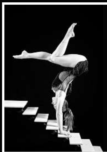
Equilibristik heißt die Kunst des Balancierens. Absolute Körperbeherrschung ist hier ein Muss